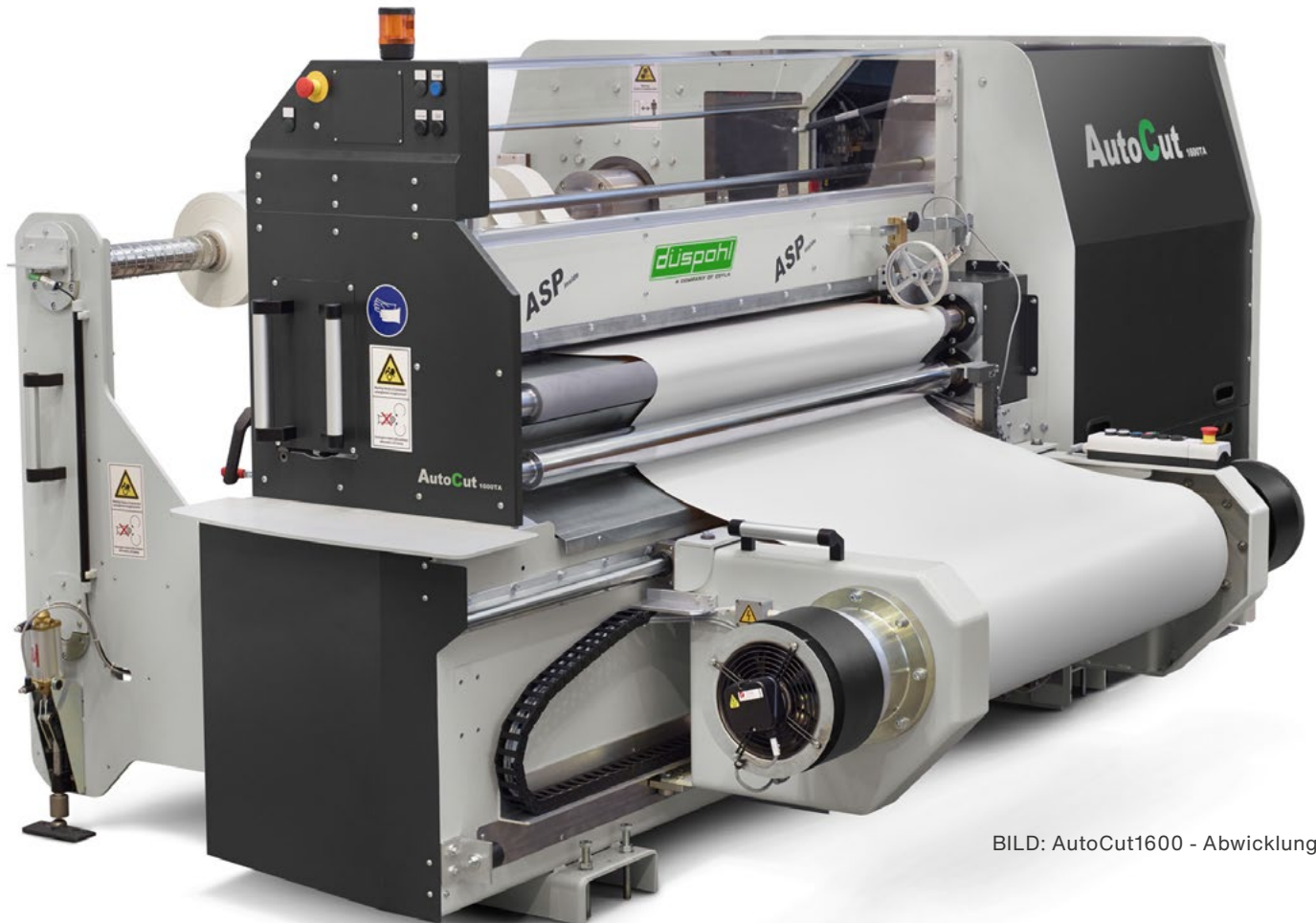
BILD: AutoCut1600 - Abwicklung